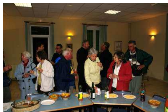
Discussions autour de rafraîchissements!

Vous pouvez suivre ce pèlerinage sur le Site http://www.pelerinage-lieux-rome.org/PlerinageRome.htm . Une équipe de FR les suivait et une émission régionale lui sera consacrée en septembre 2009.